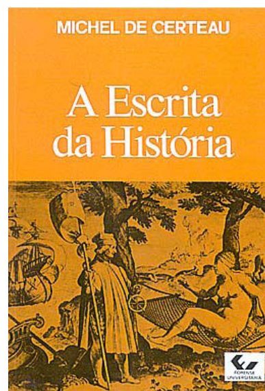
3. A edição brasileira de A escrita da história de Michel de Certeau, 1994.

Conforme suas diferentes heranças e tradições, a história cultural privilegiou objetos, âmbitos e métodos diversos. Enumerá-los é uma tarefa impossível. Mais pertinente é, sem dúvida, a identificação de