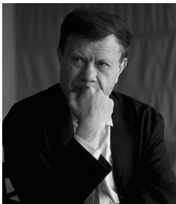
1. O historiador Roger Chartier

Fruto das pesquisas de Roger Chartier sobre as mutações da disciplina da história, realizadas desde o final dos anos de 1980, A história ou a leitura do tempo apresenta um panorama da historiografia nas três últimas décadas. O ensaio aborda os principais debates recentes da disciplina de história, desde seu estatuto de verdade, passando por sua aceitação social, a difícil relação entre história, memória e ficção, até o surgimento do livro digital e as novas formas de apresentação do texto historiográfico. Desde seu primeiro livro publicado no Brasil, A história cultural entre práticas e representações (1990) e seu célebre artigo “O mundo como representação”, publicado