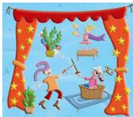
Figura 3 Ilustração Teatro

É necessário que esse professor articule outra linguagem, paralelize conceitos e as inter-relações entre eles, que discuta com seus alunos a prática exercida, e os porquês desta prática ser assim e não de outra maneira. E, sobretudo, que esse professor permita que seu aluno descubra estes princípios imanentes da própria natureza teatral no próprio exercício da criação, da ação no fazer artístico, pois um dos pressupostos do ensino de Arte é que embora nem todos necessariamente se constituam artistas, qualquer indivíduo pode produzir arte, individual e/ou coletivamente, desde que tenha disponível a linguagem e a execute de maneira integral.