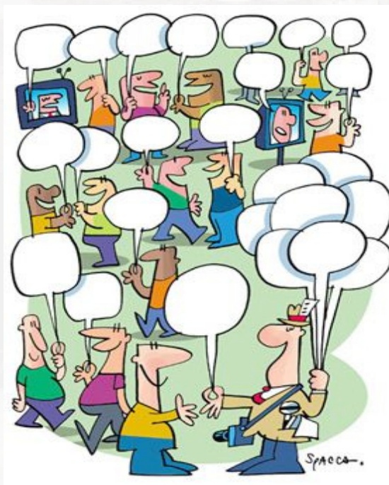
Diálogo como ação necessária ao ser humano

Há duas vozes principais, estruturadoras do romance – a do jornalista e a do morador que se diz amigo de Buell –, e “sub-vozes”, que auxiliam na construção “labiríntica” da narrativa, caracterizando a obra como um romance polifônico. A construção romanesca, neste caso, é desenvolvida através de duas partes paralelas, que se intercalam com o desenvolvimento do enredo, de um lado uma voz de uma pessoa – um homem que morava no interior do Brasil, onde Buell foi estudar tribos indígenas – que diz ter passado nove noites antes da morte de Buell Quain junto dele e que escreve uma carta destinada a alguém tentando esclarecer os fatos da morte do antropólogo; e de outro lado temos um homem que lê sobre a morte do antropólogo americano em um jornal e se interessa em buscar, desvendar o motivo que levou o jovem a se matar.