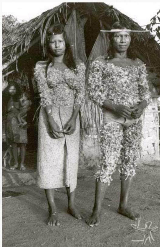
Índios da tribo Krahô