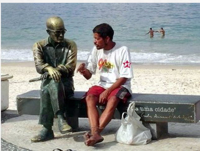
O ser humano dialoga internamente, apelando para os objetos que o cercam.

Em alguns pontos do romance carvaliano, há a narração da vida de Buell desde quando ele iniciou seu estudo com os índios, em algumas partes podemos perceber que o pesquisador sempre buscou certa distância em relação a seu objeto de estudo, para viver uma “falsa” independência, já que segundo Mikhail Bakhtin (1997), mesmo quando existe um afastamento de todas as pessoas que conhece, da sociedade, para viver sozinho e isolado, ele não consegue gozar desta sua falsa independência, pelo fato de que começa a desenvolver um diálogo interno, consigo mesmo, convencendo-se, acalmando-se e representando o outro em relação a si mesmo, ele acaba criando uma segunda voz com a qual dialoga; essas vozes distintas atuam numa relação de força, com os dois sujeitos históricos que se confrontam, tomando formas diferentes diante desse discurso que travam. O diálogo é tão importante, que quando não há com quem dialogar a personagem cria outra, mesmo que internamente, para que possa discutir; ou seja, “o diálogo permite que ele substitua com sua própria voz a voz de outra pessoa” (BAKHTIN, 1997, p.214).