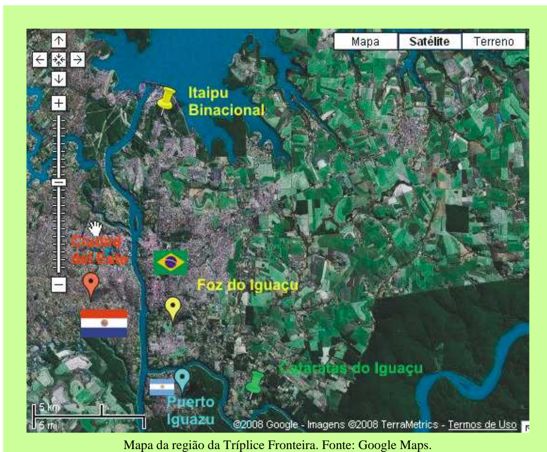
Mapa da região da Tríplice Fronteira.

Basicamente três dossiês foram analisados: 1) “Congregação do Verbo Divino de Foz do Iguaçu”. Prontuário 0325, caixa 38, 75 documentos – DOPS-PR, Arquivo Público do Paraná; 2) “Delegacia de Polícia de Foz do Iguaçu”. Prontuário 0499B, caixa 55, 36 documentos – DOPS-PR, Arquivo Público do Paraná; e 3) “Subdivisão Policial de Foz do