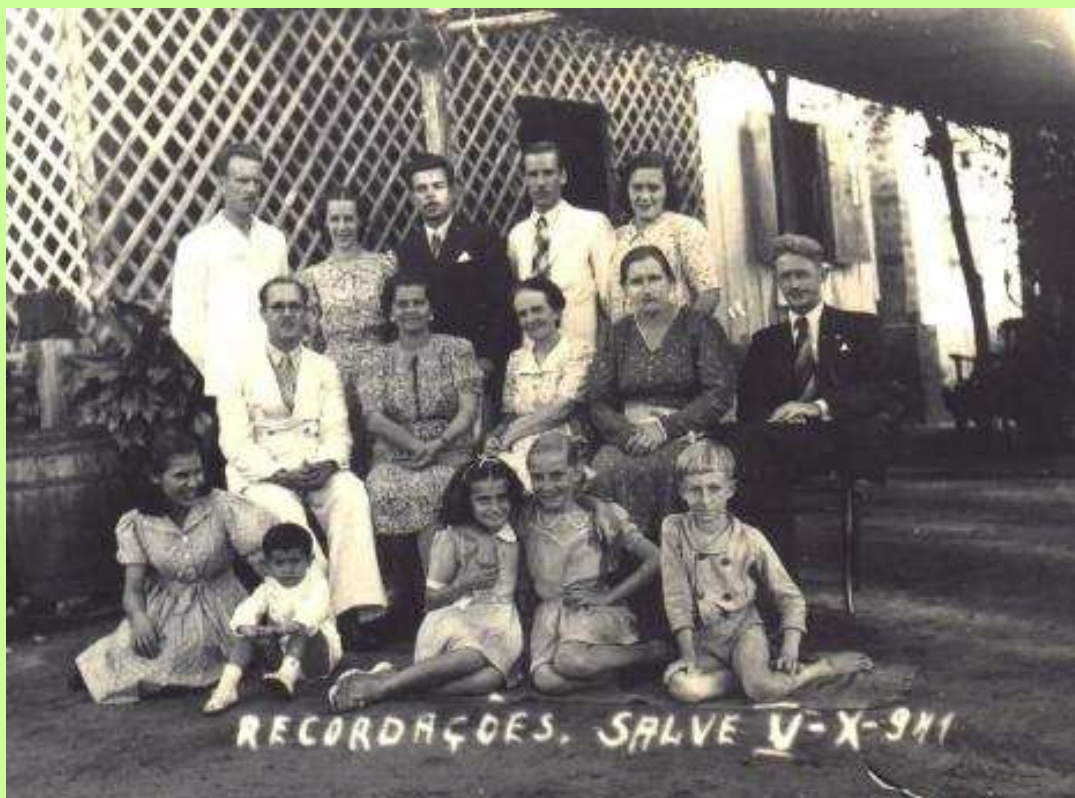
Políticos do início da década de 1940.

O que procuravam mesmo não encontraram: um nazista que mantivesse hasteada em seu quintal de casa uma bandeira vermelha com a suástica balançando ao vento. No entanto, a repressão não desistiu e, como se pode perceber a partir da análise dos documentos, incriminou pessoas e utilizou instituições para promover a idéia de combater o inimigo em próprio solo.