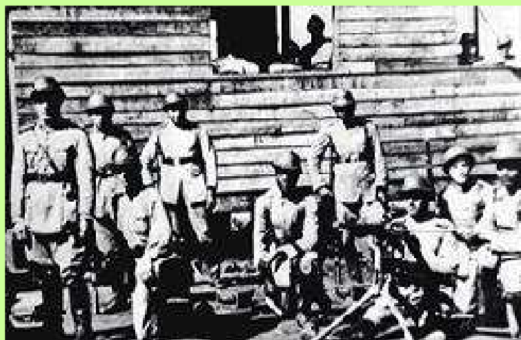
Colônia Militar no início da colonização.

Essa mesma autoridade chama o turista de estrangeiro, portanto, indivíduo desconhecido. Atenta para o fato de que essas pessoas tem dinheiro e não há motivos para não direcionarem-se ao porto oficial localizado no rio Paraná.