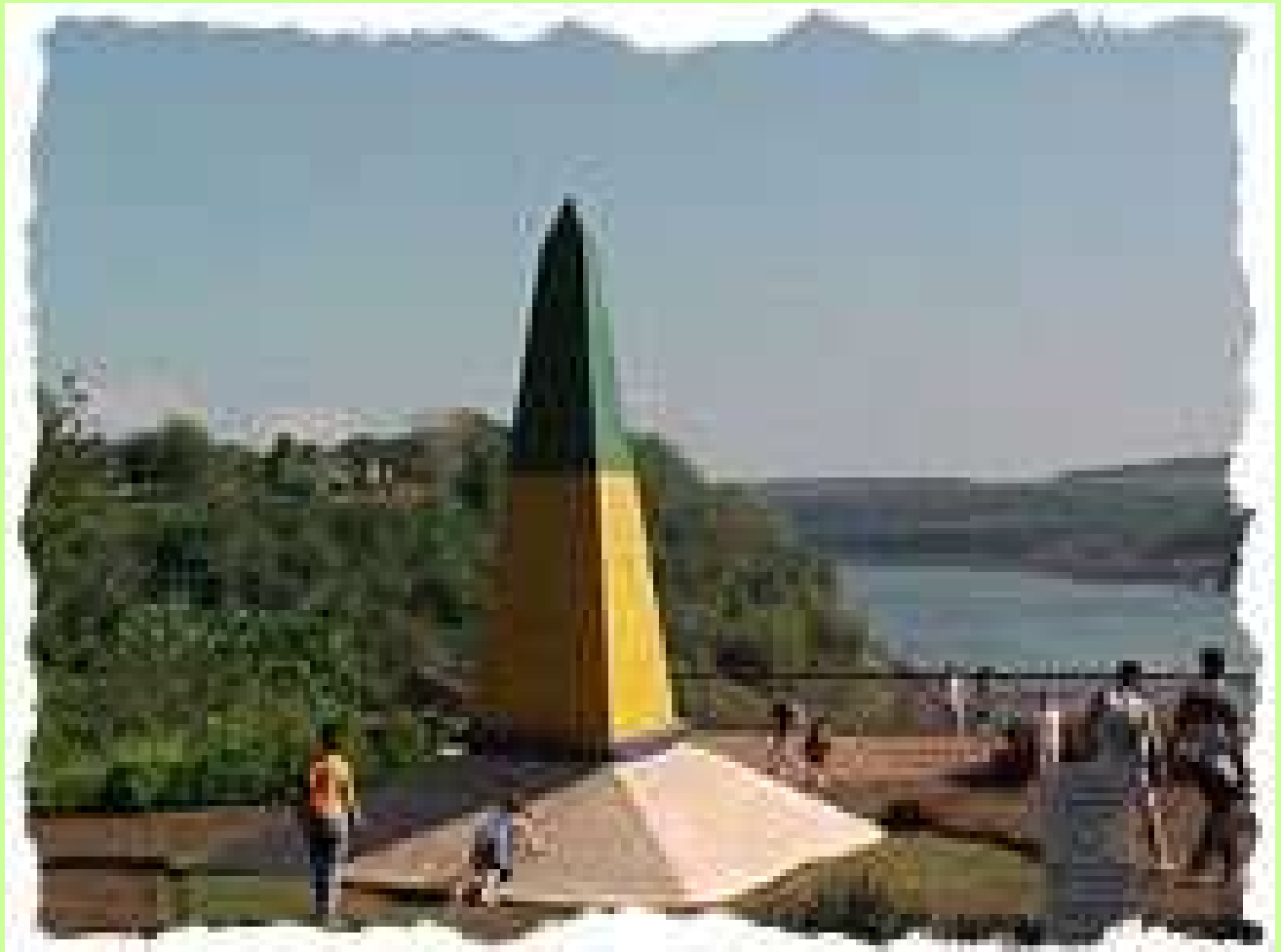
Marco das Três Fronteiras: atualmente ponto turístico de onde se vê os marco nos três países.

REZNIK, Luís. Democracia e Segurança Nacional: A Polícia Política nos pós-guerra . Rio de Janeiro: Editora FGV, 2004.