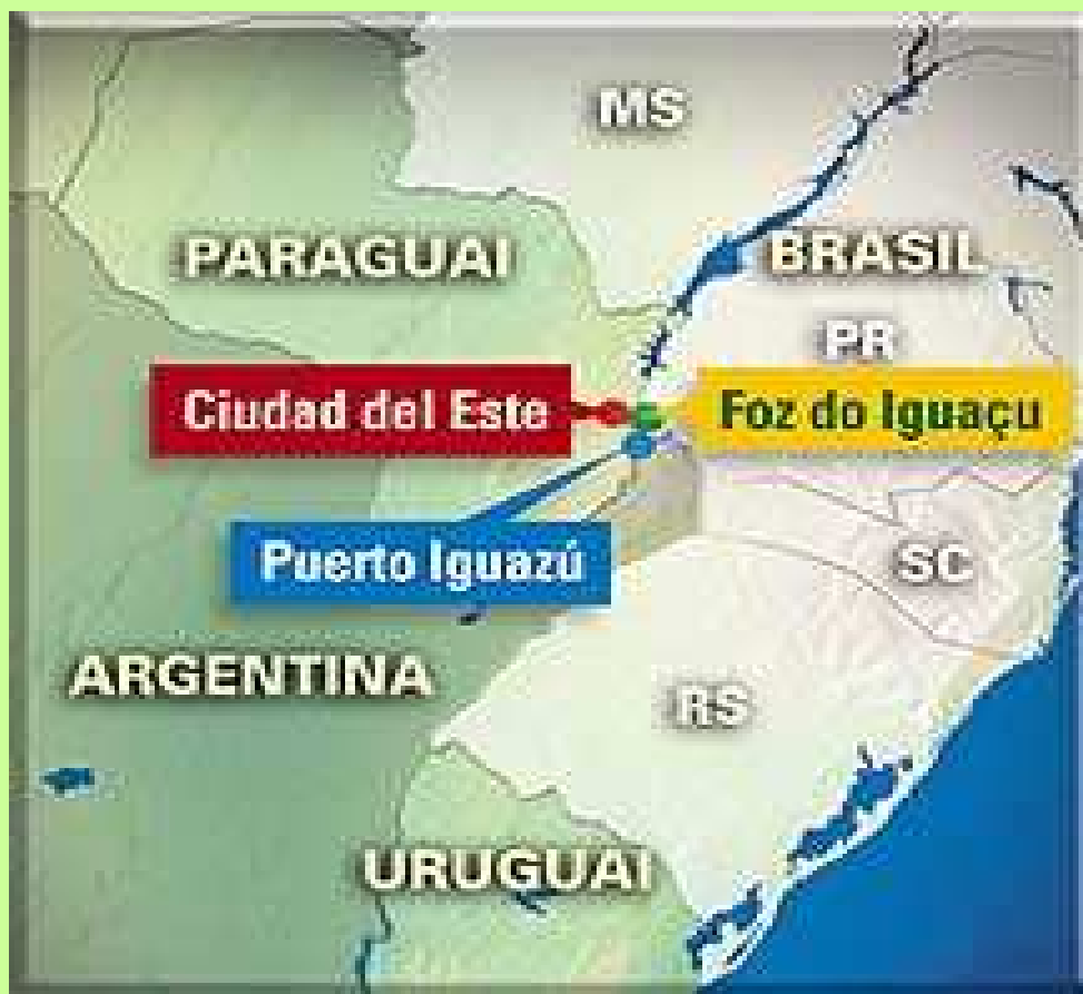
Mapa da região da Tríplice Fronteira.

Palavras-chave: História Paranaense, Estado Novo, Repressão, Tríplice Fronteira.