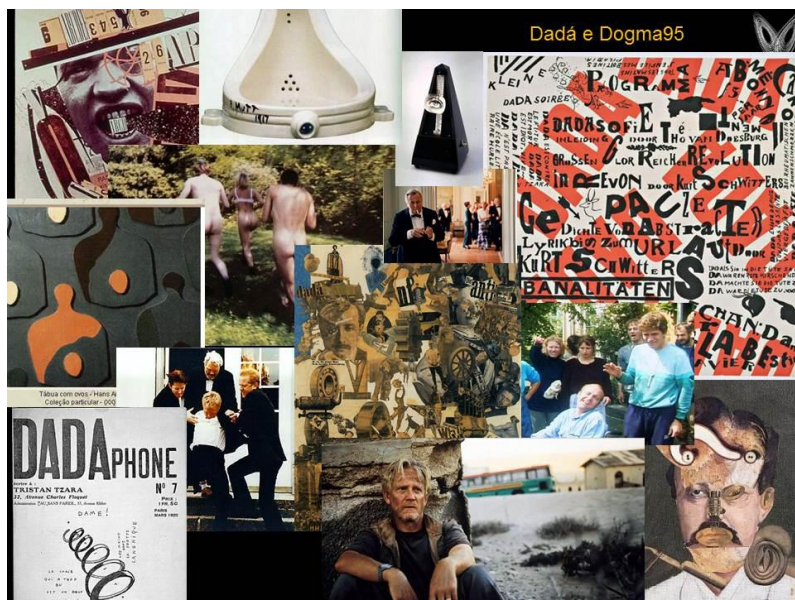
Figura 3 – Sobreposição de imagens de artistas dadaístas e frames de filmes do dogma95

estéticas, em que todos lutam juntos em uma tentativa radical de redefinir o cinema e a cultura em que existiu (MACKENZIE, 2000, p. 159-160). 5