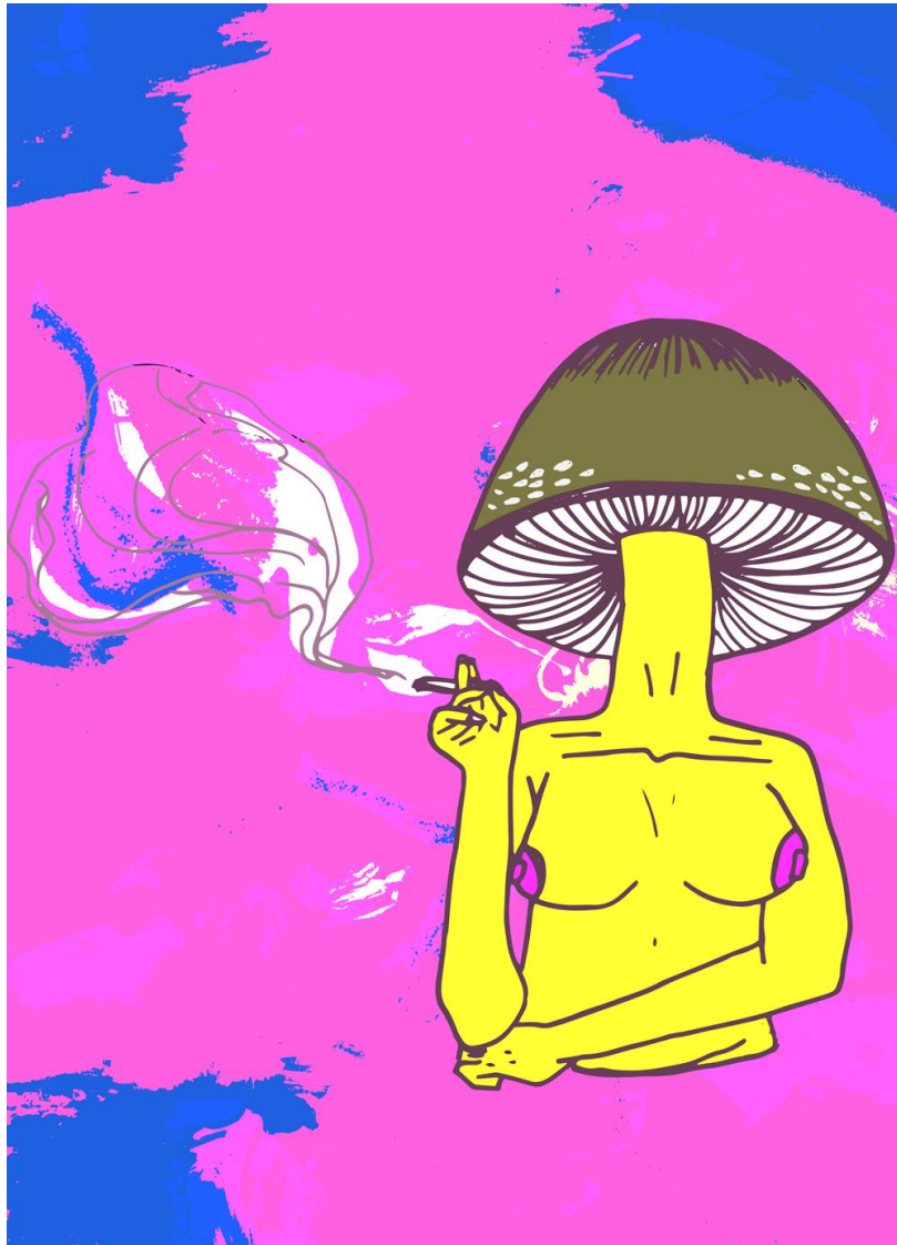
Ilustração e acervo de Betina