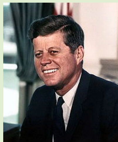
John F. Kennedy

Contudo, esses episódios contribuíram para estreitar as relações entre o governo de Castro e a URSS, fato que tornou possível o acordo que previa a instalação