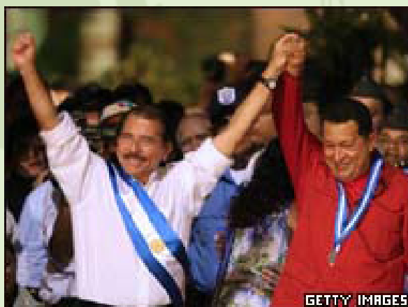
Posse de Daniel Ortega

A “Doutrina Reagan” teve como finalidade apoiar todas as iniciativas que pretendiam atacar os governos identificados como aliados ou simpatizantes dos comunistas. As práticas comuns durante as décadas anteriores marcaram essa nova fase da Guerra Fria, haja vista que na América Latina países como Guatemala, El Salvador e a ilha de Granada sofreram as conseqüências da retomada do clima de “caça aos vermelhos”. (KARNAL, 2007).