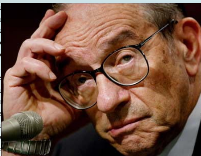
Figura 2. Karl Polanyi.

A grande transformação do sistema de mercado levou, portanto, à desarticulação da sociedade e por isso mesmo comprometeu seu próprio funcionamento. Mas, longe das previsões de Polanyi foi o retorno ao sistema que hoje comanda o mundo e ainda espera pela grande transformação que seja capaz de mantê-lo longe do colapso que delimitou o fim do liberalismo econômico criado no século XIX, a Segunda Guerra Mundial.